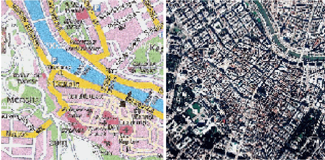
Linkse :Kaart van Salzburg. Met zwart vierkantje aangegeven de Getreidegasse Rechts: Satellietfoto van het centrum van Wenen, Iets rechts onder het midden de Stephansdom