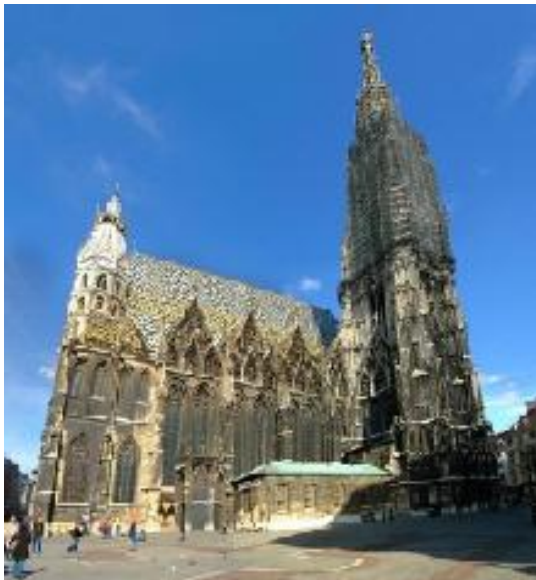
Stephansdom van Wenen

Laten we een moment uit het leven van Mozart nemen toen hij in Wenen liep voor de Stephansdom, dicht bij zijn woning aan de Domgasse 5. Kortgeleden is een satellietfoto(zie hier boven) gemaakt van het centrum van Wenen. De Stephansdom is duidelijk te zien, iets rechts onder het midden . Indien het mogelijk zou zijn geweest dat ook in die tijd van Mozart een dergelijke foto van de plek voor de Stephansdom gemaakt zou zijn, hadden we Mozart op de zonovergoten dag van 1 mei 1786 kunnen zien lopen. De dag dat zijn opera Nozze di Figaro in première ging. Het gereflecteerde licht had er dus evenals de satelliet die de Costa Concordie 0.0015 seconde over gedaan om de 'satelliet' te bereiken. Het gereflecteerde licht is nu echter al veel langer onderweg en wel 7.136.985.600 seconden. ( de tijd tussen 12 februari 2012 en 1 mei 1786 x 3.000.00.000 cm /sec).