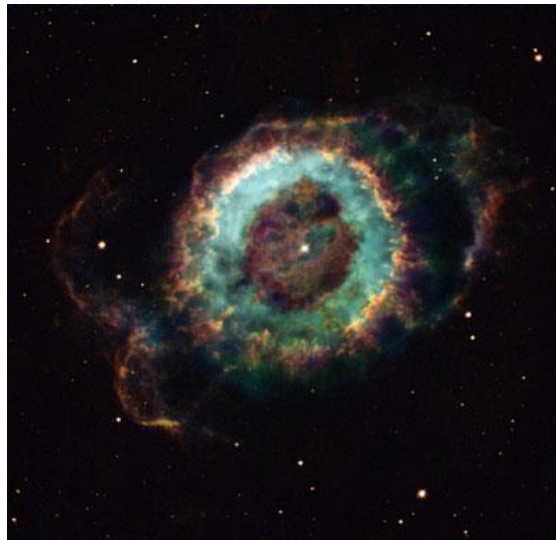
Links: Geboorte van een ster in de Adelaarsnevel in het sterrenbeeld Slang. Rechts: De stervende ster HGC6369 in het sterrenbeeld Slangendrager

Het is goed om te realiseren, dat toen het licht van deze objecten ons oog trof, deze objecten van plaats zijn veranderd en of allang zijn ontploft of door een zwart gat zijn opgeslokt. Goed te bedenken dat binnen 6 miljard jaar van onze zon niet veel meer over is dan een witte dwerg of wat gas en stof. Onderstaande foto's laten zien dat op bepaalde plaatsen nieuwe sterren ontstaan en op andere plaatsen een gewelddadige dood sterven.