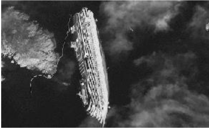
Het gekapseide schip Costa Concorde

Het gereflecteerde licht van de Costa Concorde verspreidt zich met een constante snelheid. Als het door de camera van de satelliet wordt waargenomen, zal het licht haar weg voorzetten en kan het dus ook bv na 1 miljard seconden ergens in de ons omringende ruimte worden geregistreerd.. Een vreemde gedachte, maar wij op aarde kunnen toch licht waarnemen dat is uitgezonden 413.121.600 seconden geleden door de gamma flits van de GRB 090423. Of je nu uitzendt of ontvangt maakt voor licht geen verschil. De vuistregel blijft van toepassing! Begrijpen doe ik het niet, maar ik moet het gezien de kennis van de natuurwetenschappen wel accepteren. Of maak ik ergens een denkfout? Laat het mee even weten. Mijn e-mail adres is booi382@planet.nl of 5star@tiscali.nl ( wel toepasselijke adressen) .