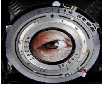
HET OOG VAN DE CAMERA